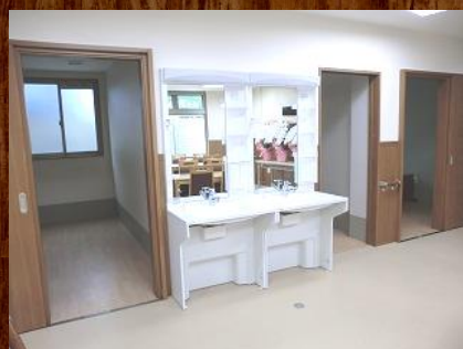
落ち着いた雰囲気の間・食堂